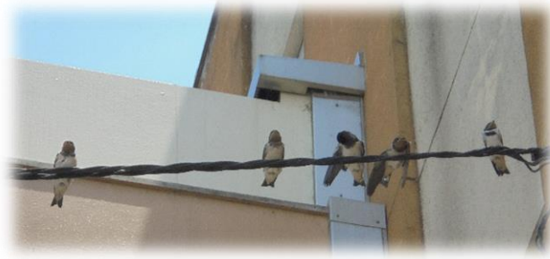
…5羽の子どもたちがついに巣の外へ、この後親子の姿を見かけておりません(巣立ったと思います)！