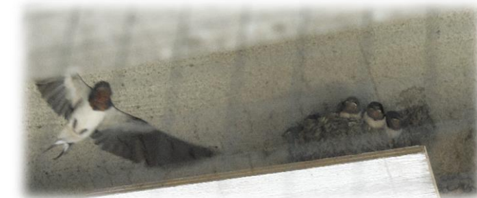
…親鳥が子どもたちの巣立ちを促すかのように、巣の周りを旋回していました！