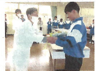
給食委員会によるありがとうの会