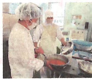
調理員さんたちもシェフと相談しながら一生懸命調理をしてくれました