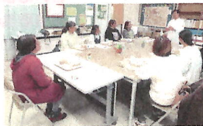
PTA 役員さんにも参加していただきました