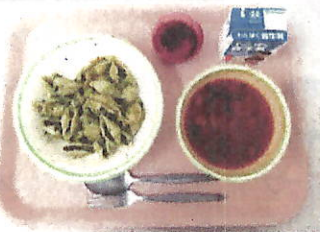
チーズ、アンチョビとコンキリエ・牛乳 カッスーラ川通スペシャル・ピーツのティラミス