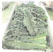
カッスーラに使用した ヨーロッパ野菜 「カーボネロ」